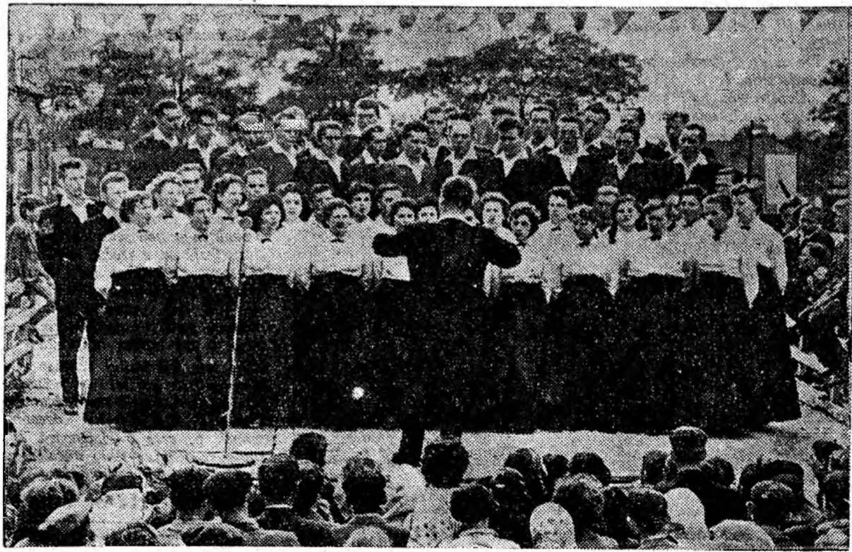
IN CLIȘEU: Corul clubului muncitoresc din Petrila, care a ocupat locul I.