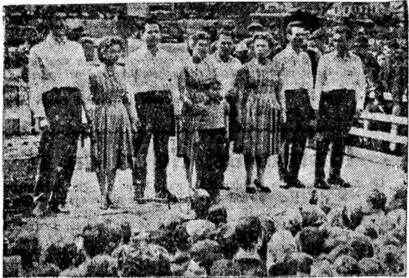
IN CLIȘEU: Brigada artistică de agitație a clubului muncitoresc din Aninoasa, cîștigătoarea locului I, în timp ce-și prezintă programul pe estrada din Piața Victoriei.

cu deosebit interes de spectatori. Intra-adevăr pe bună dreptate acești tineri talentați, harnici și perseverenți au cules aprecierea unanimă pentru programul lor cu un conținut bogat cuprinzînd problemele esen-