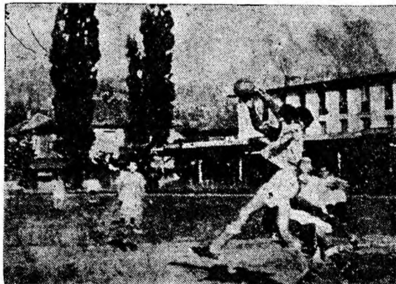
IN CLISEU: O fază din meciul Minerul Vulcan — Minerul Petrila, la poarta vulcănenilor.