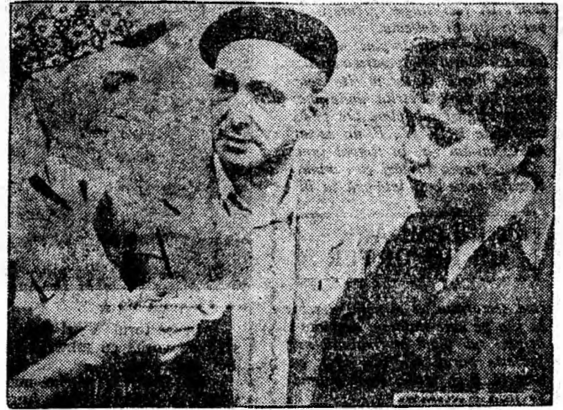
ÎN CLISEU: O scenă din film.

lăturată numai pentru un timp deoarece ea înțelege și simte ajutorul dat de colectiv. În acele zile de lipsuri și greutate se formează sentimentul solidarității muncitorești, oamenii ajutându-se reciproc pentru lichidarea urmelor războiului. Totodată în film sînt demascate afacerile necinstite ale unor patroni care sînt nevoiți să părăsească sectorul de-