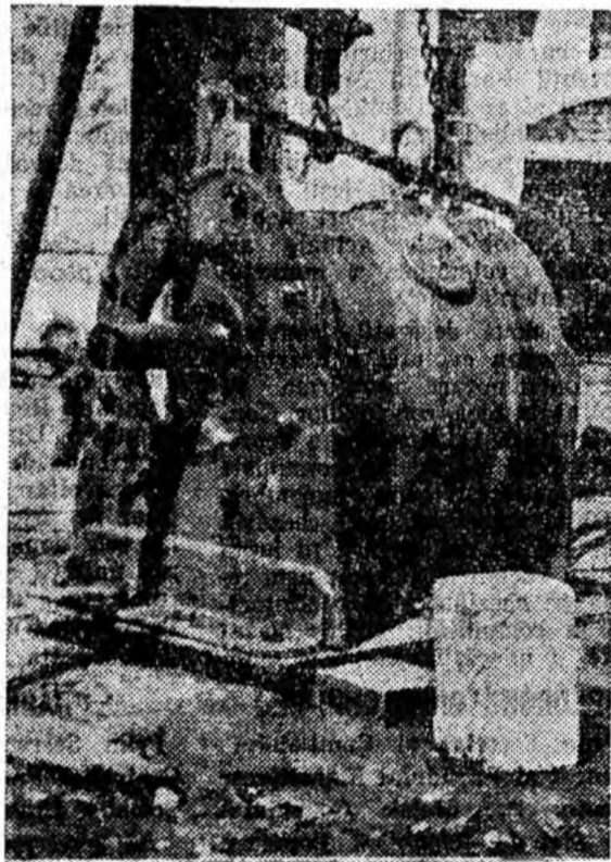
IN CLIȘEU: Angrenajul confecționat din diferite piese reconșionate.

— Ați făcut o treabă faină — le spuse maistrul mecanic al sectorului. Prin repararea angrenajului s-au realizat economii în valoare de 40—45.000 lei.