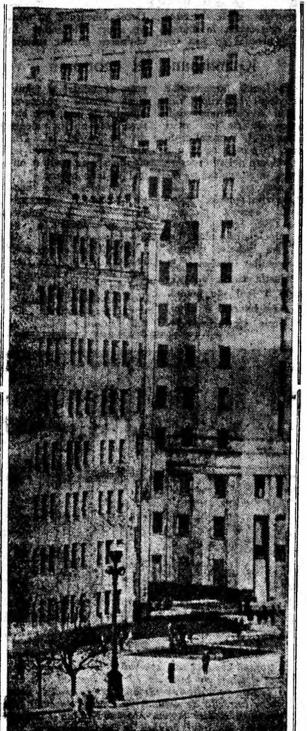
Noua clădire a facultății de fizico-matematici a Universității din Harkov.

Cineaștii au petrecut un an și jumătate în Uzbekistan, unde au trăit alături de eroii viitorului film bucuriile victoriilor lor în muncă și mînbînirele insucceselor vremelnice provocate de forțele naturii. Din enormul material adunat cineaștii au selecționat cîteva episoade centrale care, după părerea lor caracterizează cel mai preg-