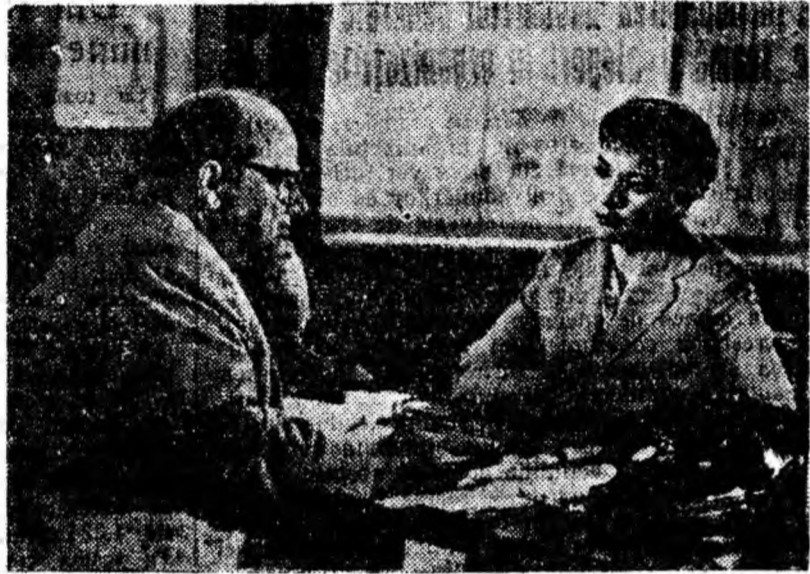
IN CLIȘEU: O scenă din film.

se vede în situația cînd trebuie să ascundă sentimentul său tînerii ziariste, preferînd, ca și pînă atunci, să se sacrifice singur decît să sufere alții. Dar, întîmplarea neprevăzută îl face indisponibil și pentru activitatea sa pe care o practicase cu atîta pasiune.