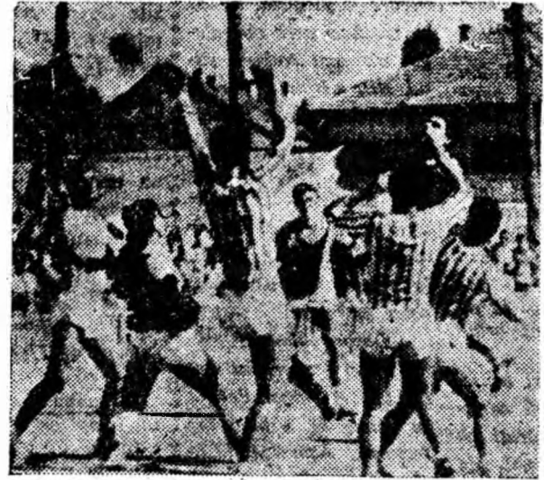
IN CLISEU: Un nou atac la poarta dinamoviștilor.

Obișnuți cu victorii (și încă la scor!) înflăcărații în 7 Știința Petroșani erau gata-gata să guste, alături de jucători, din cupa amară a înfrîngerii. I-a scutit de aceasta nervozitatea și teama dinamoviștilor din Brașov de a vedea trecînd și ceea ce de la etapa trecînd să cumuleze nici un punct, precum și intrarea (deși tîrzie!) a lui Sill (unde a fost oare pînă atunci?) care, pe lângă faptul că a marcat două puncte de toapă frumusețea, a adus în echipă revirimentul mult așteptat.