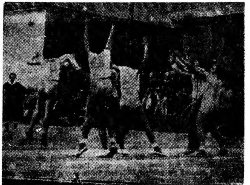
IN CLIȘEU: Atac la poarta gazdelor.

Dacă în prima repriză balanța victoriei a înclinat cînd spre echipă cînd spre cealaltă, în cea de a doua, cu cît meciul se apropie de sfîrșit, se vedea tot mai lămurit care echipă va fi învingătoare. Organizîndu-și mai