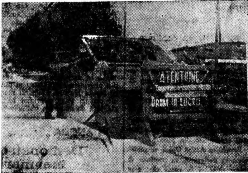
În Petrița se continuă asfaltarea șoselei înspre Lonea.