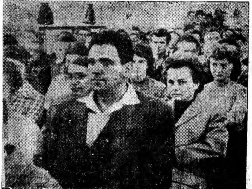
IN CLIȘEU: Aspect din sala clubului C.C.V.J. în timpul adunării festive de deschidere a noului an universitar.

— Intregul nostru popor își îndreaptă azi atenția către voi, dragi studenți și vă urează succes deplin la învățătură, din pri-