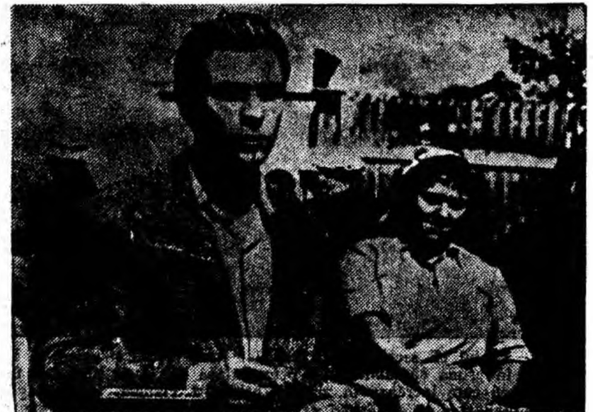
ÎN CLISEU: O scenă din film.

Anton rămăs singur pleacă și regăsește detașamentul de partizani. Raportul său provoacă o mare emoție și neliniște în rîndul partizanilor. Trădarea pricinuită i-a făcut să piardă legătura cu un grup antifascist și cu