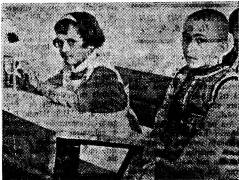
Școală nouă, cunoștințe noi, prieteni noi...