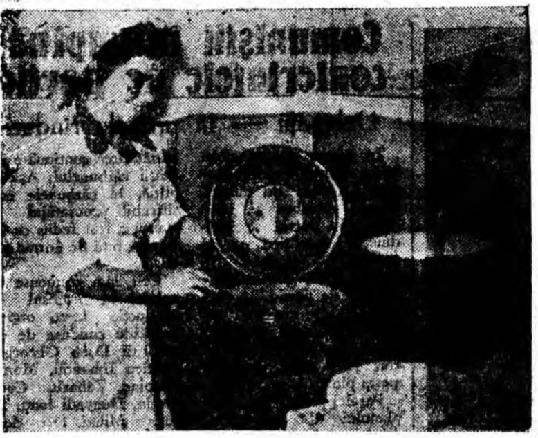
După cum se vede și din clișeu, încântăreașă zimboște mulțumită. Are și de ce. Mincarea e foarte gustoasă. Poftă bună.