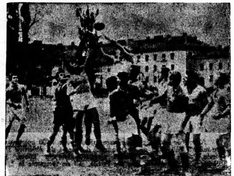
Fază din întîlnirea de rugby din cadrul turneului de calificare dintre Jiul Petroșani — Minerul Vulcan. Meciul s-a terminat la egalitate 3-3