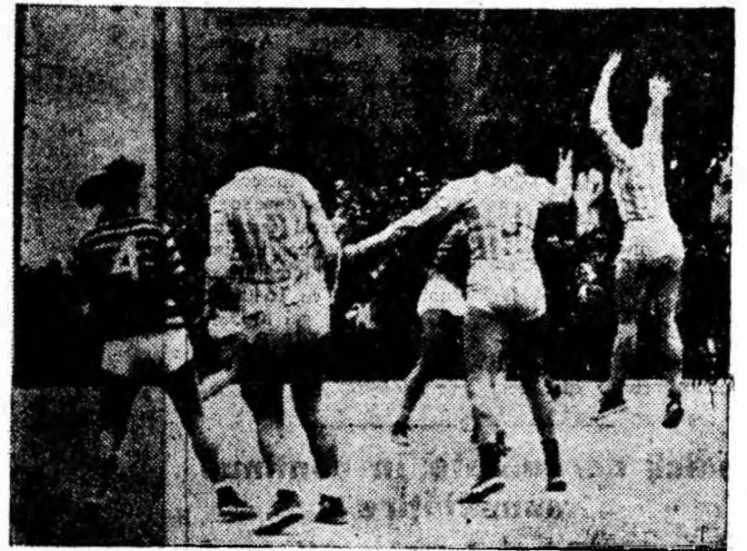
O fază din meci

decise să majoreze scorul, jucătoarele din Petroșani încep „tare” repriza a doua. În minutul 24, un atac al gazdelor nu poate fi oprit decît prin fault. Arbitrul Weisenbau din Timișoara acordă pe bună dreptate lovitură de 7 metri, transformată inpecabil de Khellner. Din acest moment, jucătoarele de la I.T.B. par decise să reducă din handicap, ceea ce și reușesc astfel că în minutul 28