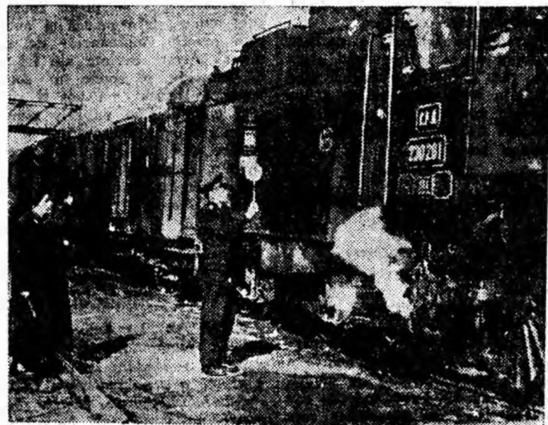
Locomotiva este sub presiune. Mecanicul de locomotivă zîmbește impiegațului de mișcare care îi arată paleta spunîndu-i obișnuitele cuvinte: Cale liberă...