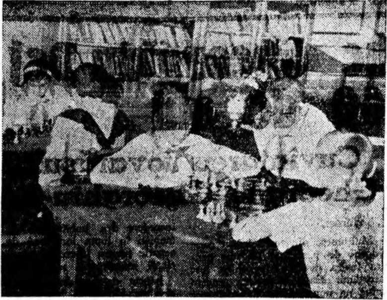
Un moment de recreare plăcut și instructiv la Școala de 7 ani nr. 1 Petroșani.