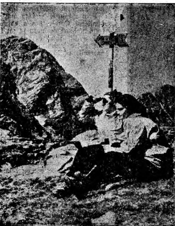
Popas pe Căstura Bucurii din muntii Retezat.

...un specimen viu de „monitor” fără urechi din Borneo a fost capturat de curînd? Această șopîrlă foarte rară constituie un vestigiu al fenomenelor care au marcat, acum cîteva sute de milioane de ani, trecerea de la saurieni la șerpi.