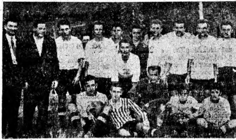
...Echipa de fotbal „Paringul“ Lomea.