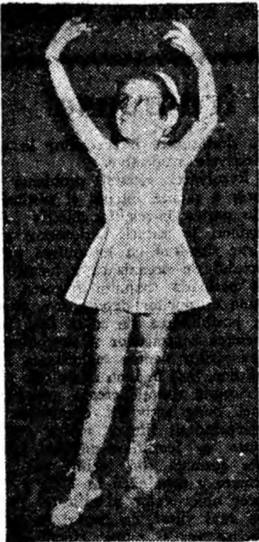
Primii pași spre grație, suplețe și măiestrie.

...Nedeea, sau nedea, un tip cu tradiții foarte vechi, care confirmă o viață pastorală intensă în Carpații noștri și în epoca întemeierii principatelor a lăsat numeroase urme în toponimie? Iată cîtiva munți care poartă asemenea nume: Nedeea (2054 m.) în munții Căpășinii; Piatra Nedeei (1438 m.) în munții Semiculului; Nedea (1806 m.); Nedea în muntele Oslea, la sud de munții Retezatului; Nedea Gaibenului și Nedea Scoabelor, în partea nordică a Retezatului; Nedea de la sud de Pietrosul Mare (m. Rodnei); Cornul Nedeei, la nord de pasul Prislopului; Bîtea Nedeei în munții Bistriței. De remarcat că munții care poartă aceste nume, nu sînt piscuri ascuțite, ci se termină cu spîrări late.