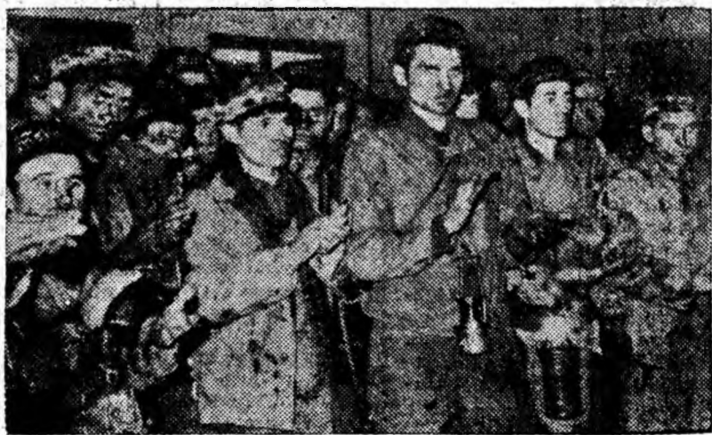
Aspect din timpul adunării festive.