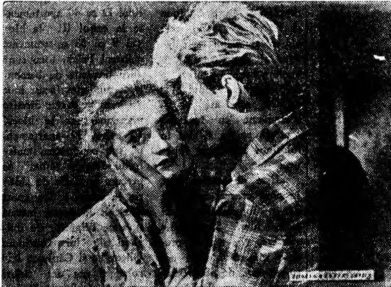
Incepînd de ieri, la cinematograful „Al. Sahia” din Petroșani rulează filmul „Lumină la fereastră” o producție a studiourilor sovietice.

De pildă, clubul muncitoresc din Vulcan și-a propus în această lună trei conferințe tehnice dintre care două cu temele: „Prevenirea și combaterea focurilor de mină” și „Perfecționarea procedurilor de săpare a sulțurilor” s-au ținut fiind audiate de un mare număr de muncitori, iar cea de-a treia intitulată „Economisirea lemnului de mină la săparea lucrărilor miniere”, urmează să se țină miercuri 27 decembrie a. c. la orele 17, în sala de ședințe a clubului.