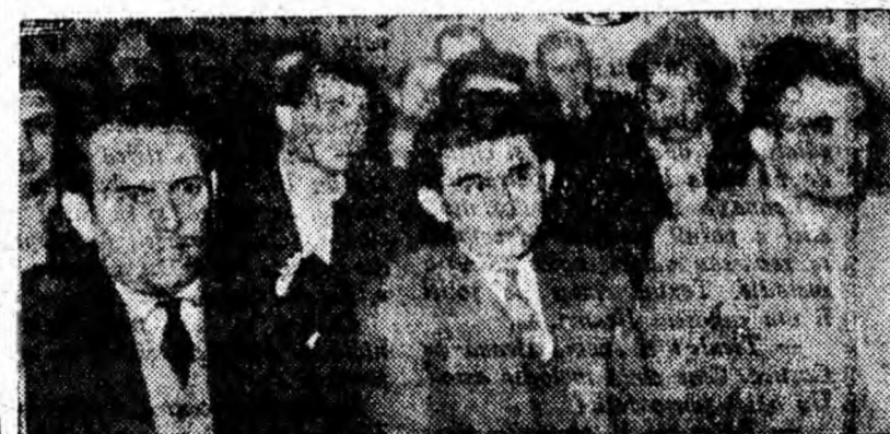
Participanții la schimbul de experiență ascultînd cu atenție referatele prezentate.

Îndrumat de către organizația de partid din sector și de către comitetul sindicatului pe exploatare, comitetul de secție, în noul an ce urmează, este hotărît să îmbunătățească și mai mult organizarea întrecerii socialiste, să perfecționeze metodele folosite. Sintem convinși că numai așa vom izbuti să traducem în viață sarcinile de plan pe 1962 precum și angajamentul de a da peste plan 7.700 tone de cărbune.