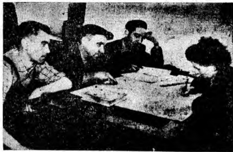
Comisia pentru soluționarea litigiilor de muncă de la Viscoza-Lupeni întrunită în ședință.