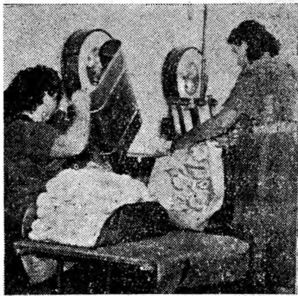
Aspect din secția de împachetare a sculurilor de mătase de la „Viscoza” Lupeni.

Măsurile tehnico-organizatorice luate precum și munca entuziastă a minierilor și tehnicienilor noștri, în frunte cu comunistii, va face ca în toate frontalele minei Lupeni să se realizeze cu succes obiectivul „3 fișii la două zile”.