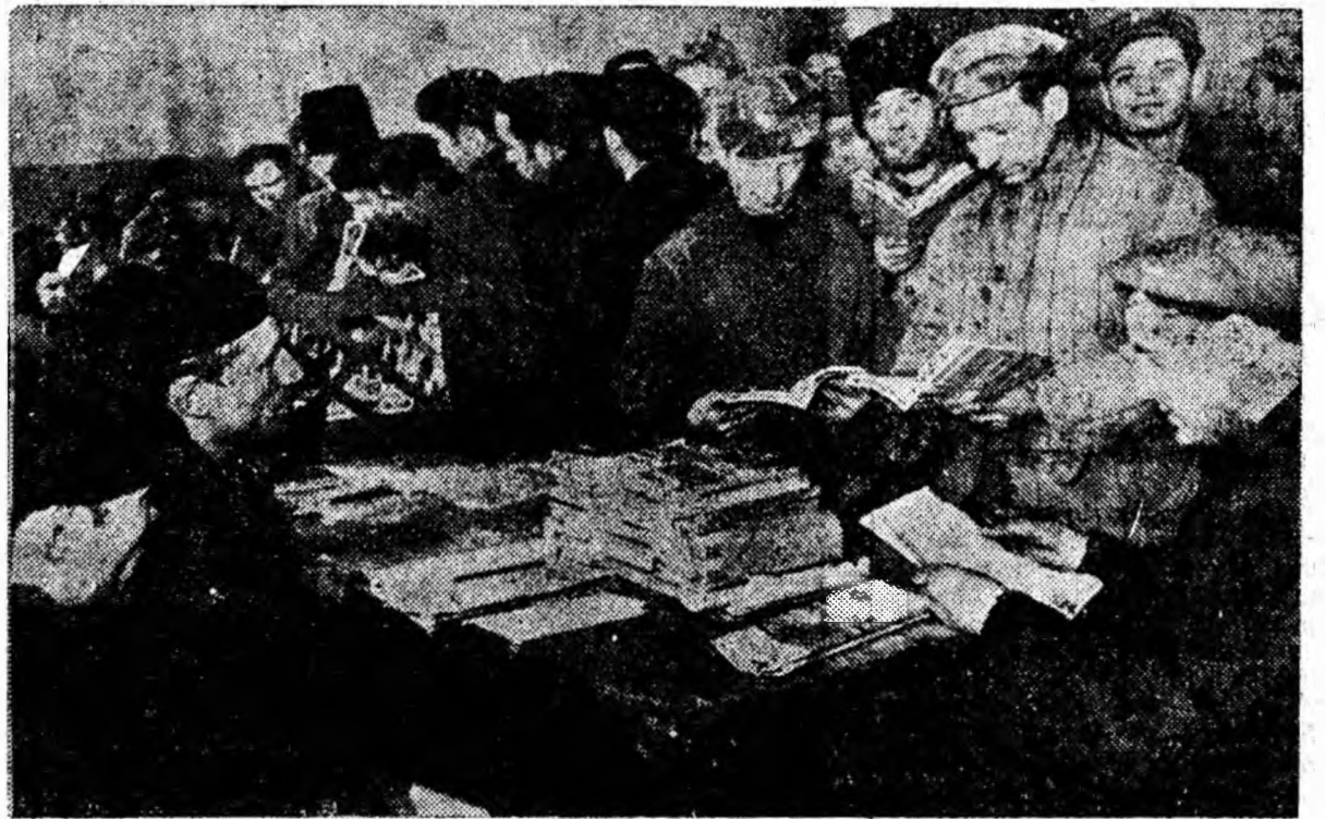
Cartea este un prieten bun, căutat cu tot mai multă insistență de către minerii din Vulcan. Difuzorii voluntari ai cărții au mult de lucru. De-abia prindesc să mulțumească pe toți cei care doresc să-și îmbogățească bibliotecile personale cu o carte politică, literară sau tehnică.

IN CLIȘEU: Un aspect de la standul de cărți cu vizuare de la mina Vulcan.