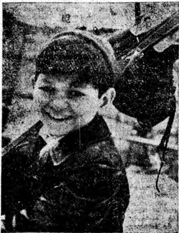
— Ce bine-mi pare că a nins — pare a spune zimbetul larg al băiețașului din clișeu. Și cu schiurile la spinare, voinicul a luat pieptiș dealul de pe care va cobori vertiginos pe covorul alb scînteietor al zăpezii.