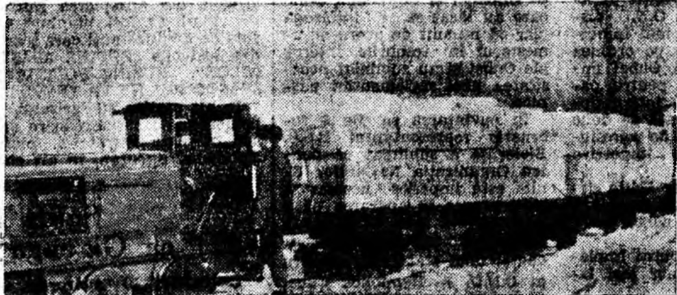
A sosit un nou transport de materie primă — celuloză — din care hârtiile muncitorilor ai Viscosei Lupeni vor produce fire de mătase pentru țesăturile din țară. Un aspect din timpul transportării baloturilor de celuloză.

De calitatea membrilor și candidaților de partid, de felul cum ei militază pentru aplicarea politicii partidului depinde în mare măsură capacitatea de mobilizare a organizațiilor de partid la traducerea în viață a sarcinilor puse de Congresul al III-lea al partidului în fața minerilor.