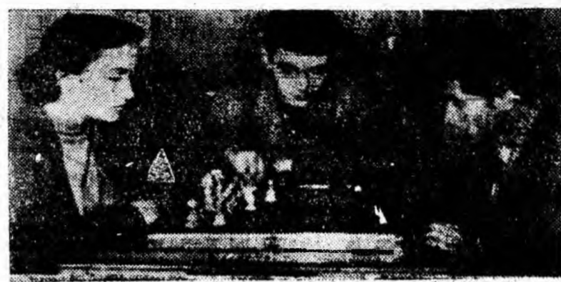
Zîmbic la clubul muncitoresc din Vulcan se întîlnesc mulți tineri în orele libere petrecîndu-și timpul plăcut și util. IN CLISEU: La o partidă de șah.