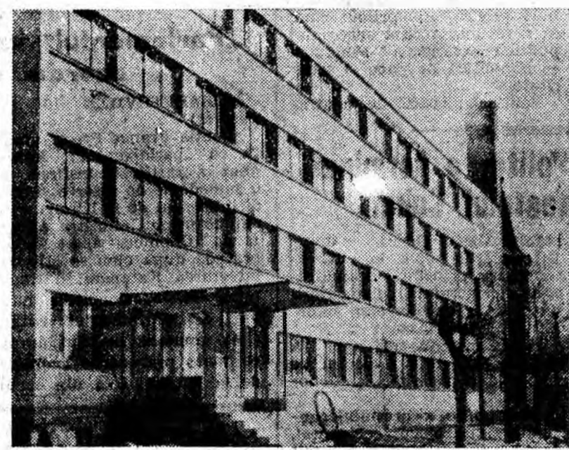
Noul cămin studențesc cu 330 locuri, dat ieri în folosință.