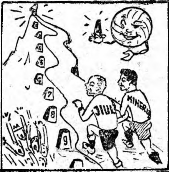
Ascensiune favorabilă. Coborîre periculoasă.