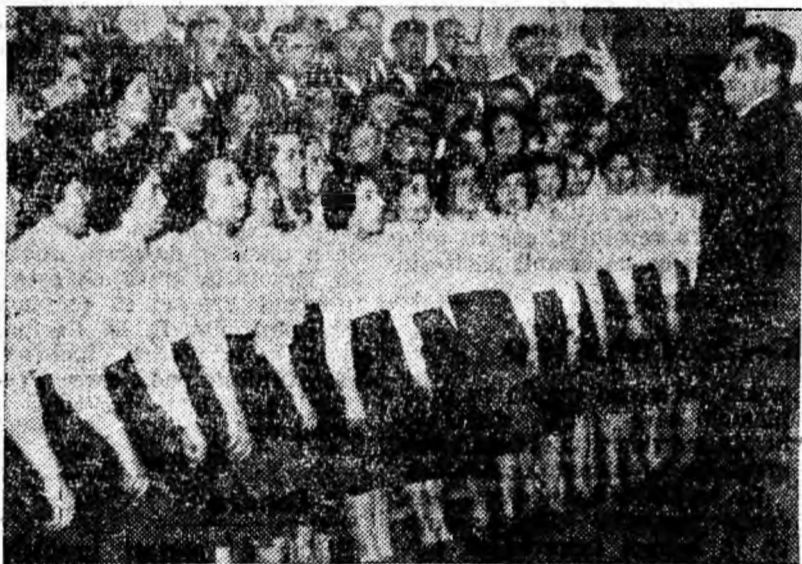
ÎN CLIȘEU: Un aspect de la spectacolul prezentat de corul Clubului Central al Sindicatelor din Petroșani

„Succesul primului spectacol, a trecut și iată-i acum din nou pe coriști la treabă, învățînd noi cîntece. În fiecare luni au repetiție femeile, miercuria bărbații, iar vineri întreg ansamblul coral. Succesul obținut la primul spectacol dă speranța că în curînd corul se