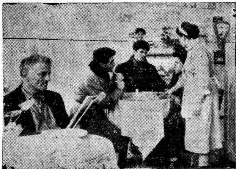
Duminică, în centrul orașului Petroșani, s-a deschis un local destinat dieteticilor — lacto-barul „Miorița”.

ÎN CLIȘEU: Un aspect din interiorul lacto-barului „Miorița”.