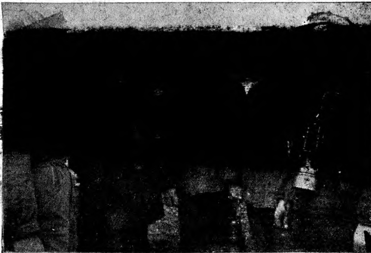
Artificerii de la sectorul III al minei Vulcan se străduiesc să asigure la timp pușcarea în fiecare abataj, contribuind astfel la bunul mers al producției.

Instruirea activului sindical din întreprinderi și instituțiile Văii Jiului va contribui la ridicarea nivelului activității organelor sindicale din aceste unități, la îmbunătățirea întregii activități sindicale.