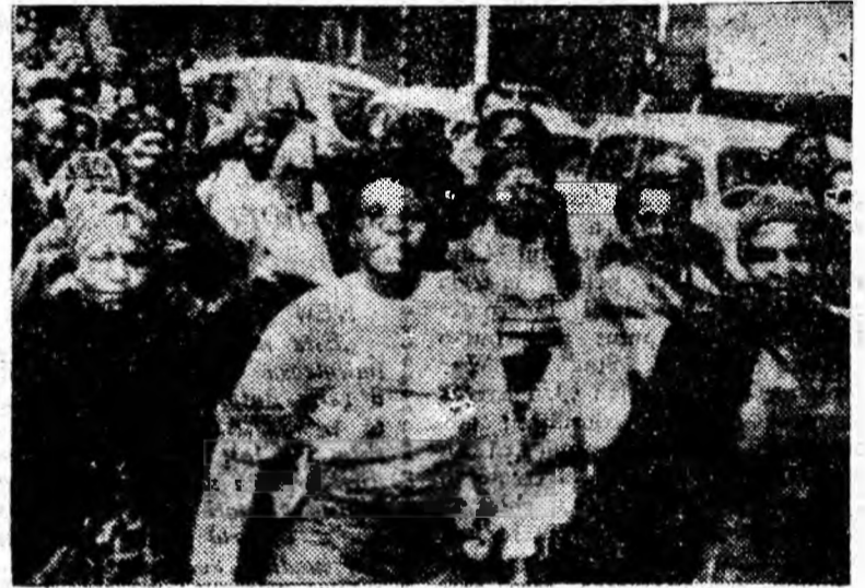
În Republica Sud-Africană, țară cu 15.500.000 locuitori dintre care 4 cincimi sînt negri domnește cea mai cruntă teroare rasistă. Dar și în această „republică albă” se duce o luptă hotărîtă pentru desființarea politicii de apartheid. În clișeu, manifestație a populației de culoare la Johannesburg.

Fără îndoială că hotărîrea manifestată de poporul și guvernul României de a contribui la sprijinirea eforturilor depuse de statele africane pentru lichidarea inepietății lor economice și sociale, va aduce noi prieteni țării noastre, va mări numărul țărilor care colaborează între ele pe baza coexistenței pașnice.