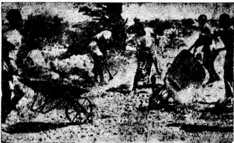
Somalia este una din țările africane care și-a cucerit recent independența. Una din moștenirile epocii coloniale: lipsa de drumuri și șosele. În prezent au început să se construiască șosele moderne.