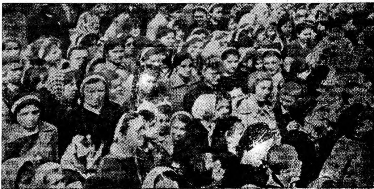
Ca de fiecare dată, tineretul din Petroșani a fost prezent în număr mare la sărbătorirea oamenilor muncii de pretutîndeni 1 Mai 1962.

Pe fețele tuturor sportivilor se citea bucuria zilelor însoțite care le trăiesc, recunoștința față de partid pentru posibilitățile multilaterale create de partid sportivilor noștri.