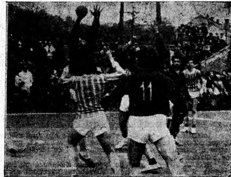
ÎN CLIȘEU: O fază de la întîlnirea de handbal în 7, masculin Știința Petroșani — Rapid T. Mureș

de a înscrie comis și apărători- lor care au comis citeva greșeli de care au profitat jucătorii de la Chimia Govora.