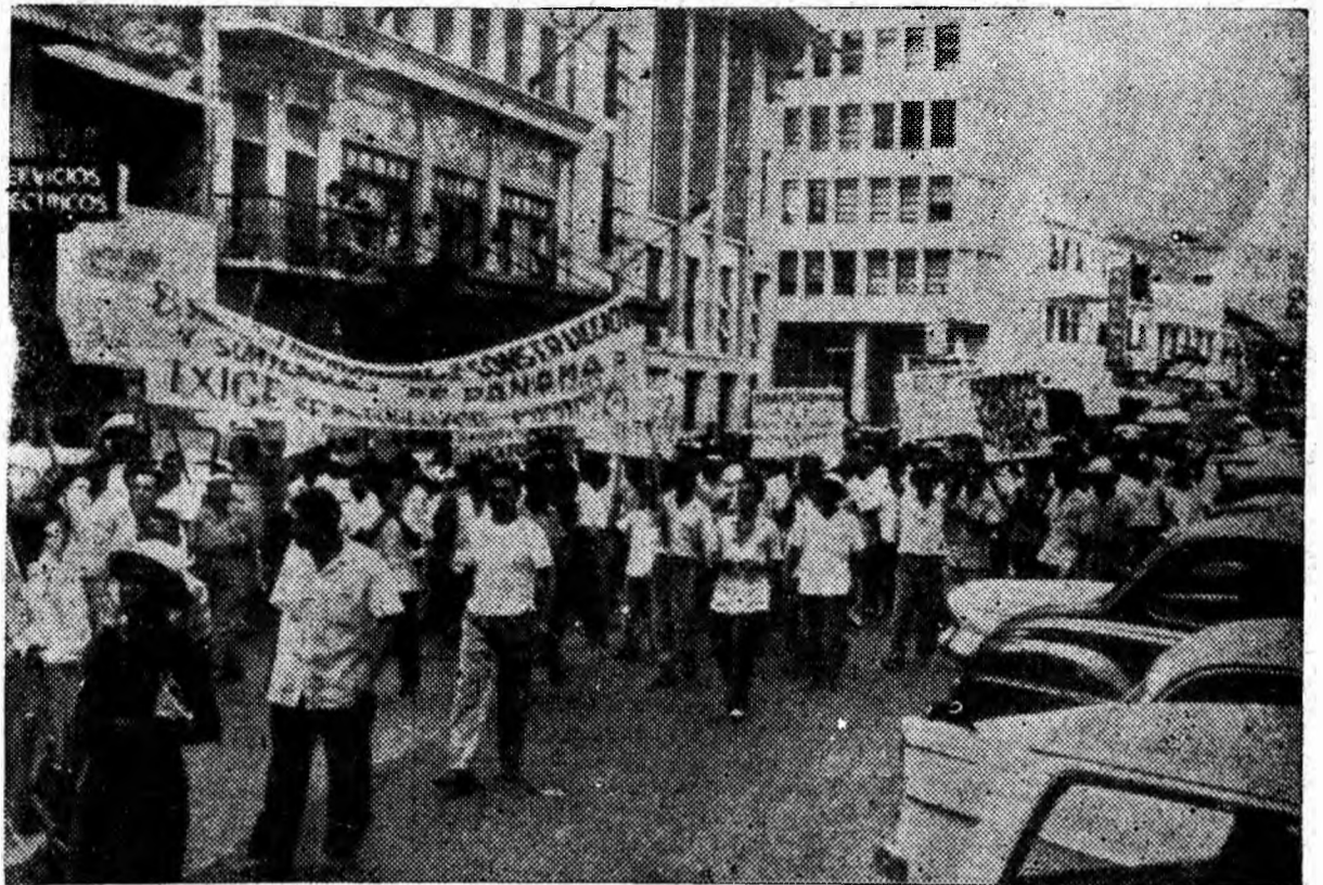
Muncitorii constructori din Panama manifestează împotriva salariilor de foamete pe care le primesc, pentru ridicarea nivelului lor de trai.

BERLIN. La 7 mai cancelarul R.F.G. Adenauer, a sosit pe bordul unui avion american într-o vizită de două zile în Berlinul occidental. Scopul acestei călătorii este de a ridi-