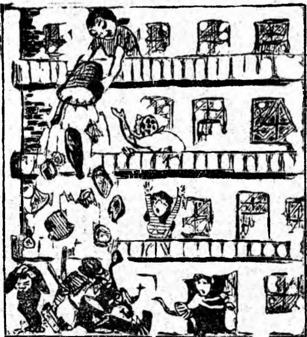
— Vecinilor, ferțiți-vă. Colocatarea noastră de la trei iar „face curățenie“.

„Gospodina“ Bejenaru Elvira din Petroșani str. Republicii nr. 46 aruncă resturile menajere de la etajul III.