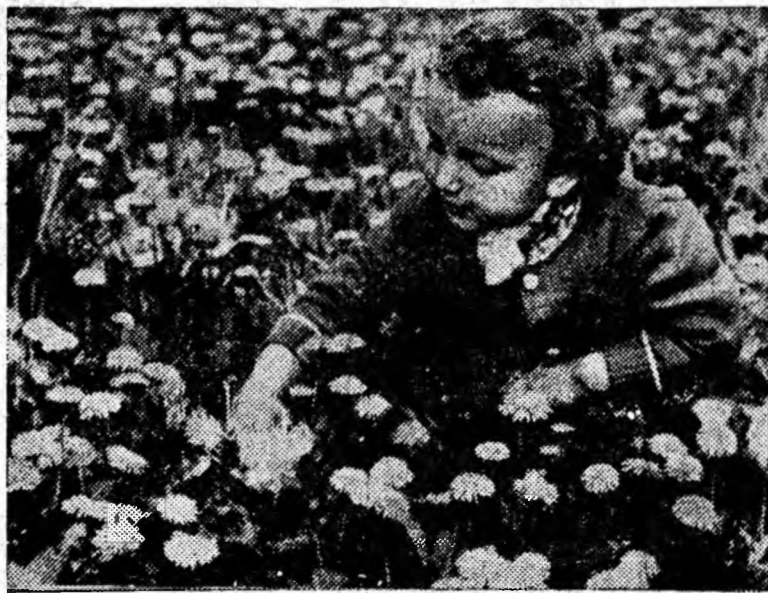
Flori de primăvară.

Acest frumos succes are în mare parte la bază contribuția minerilor din sectorul IV Priboi care, ridicând randamentul pe sector la 2,300 tone pe post, au depășit planul pe prima decadă cu aproape 700 tone de cărbune. Toate brigăzile sectorului plasate la cărbune și-au depășit sarcinile de plan.