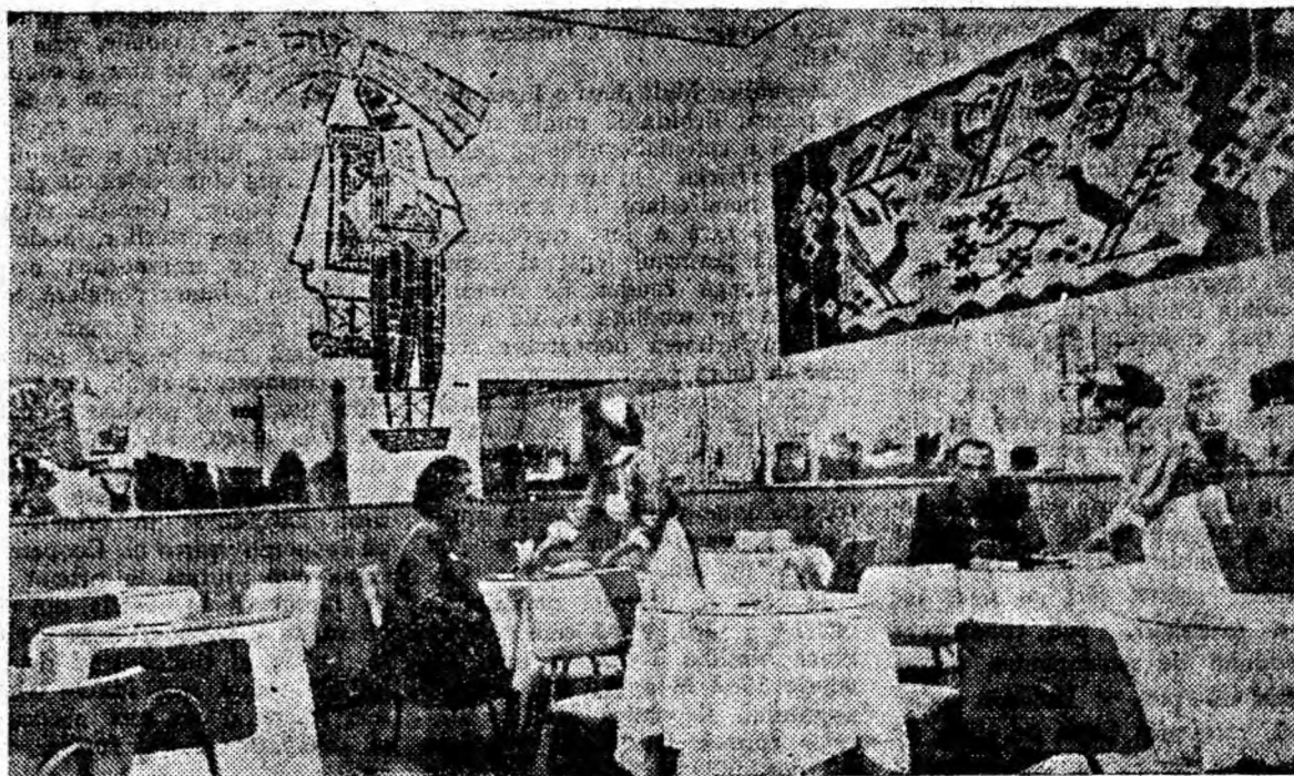
Soră mai mică a lactoba rului „Miorița“, dar la fel de frumoasă și bine amenajată, plăcintăria „Minerul“ din Petroșani te îmbie să o vizitezi.

Sub acest titlu a fost publicată o notă critică la adresa Oficiului P.T.T.R. Petroșani. În notă se arată modul defectuos de distribuire a imprimatelor la ghișeul de mandate prezentate, precum și greutățile ce decurg din aceasta. În urma articolului publicat, conducerea oficiului P.T.T.R. Petroșani a luat măsuri ca pe viitor să nu se mai greșească. Astfel s-a trecut la reorganizarea serviciului de la ghișeul mandate, luîndu-se măsuri ca imprimatele să se vîndă la alt ghișeu. În ce privește funcționarea vinovată, acesteia i s-a făcut observația cuvenită.