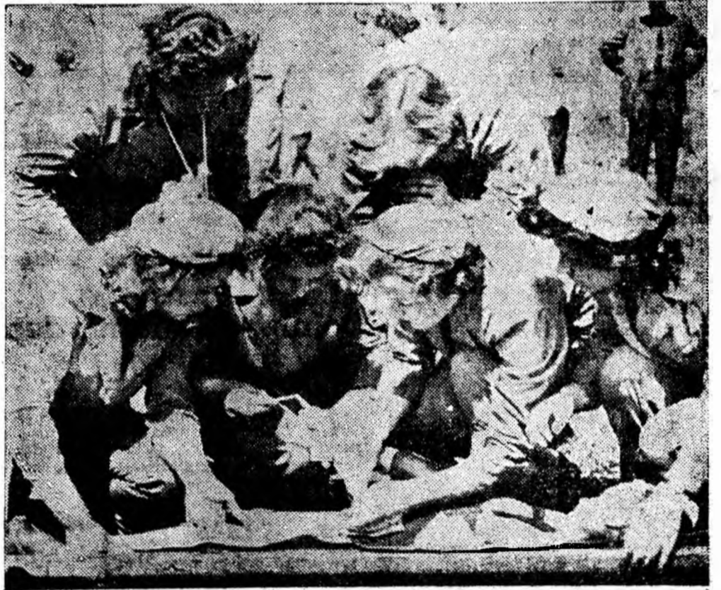
IN CLISEU: Aspect din timpul probei practice a grupei sanitare de la U.R.U.M.P.

un real sprijin în murca organelor sanitare în menținerea sănătății colective, în prevenirea și combaterea bolilor. Concursurile organizate pînă acum, ca și cel de azi, dovedesc buna lor pregătire teoretică și practică. Pe noi ne ocurează faptul că la activitatea grupelor sanitare iau parte un mare număr de gospodine și muncitoare, femei care de-