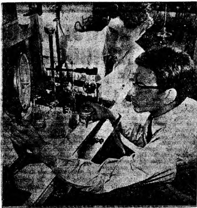
Tuturor tinerilor specialiști le este asigurată o muncă creatoare în domeniul pe care și l-au ales. ÎN FOTO: tineri ingineri fizicienți efectuînd cercetări în laboratorul spargătorului de gheață atomic „Lenin”.

În prezent, în Uniunea Sovietică, 40 la sută din totalul muncitorilor și 23 la sută din totalul țaranilor au studii medii și superioare. Fiecare al 4-lea om sovietic învață. Numărul școlilor de cultură generală este de 244.000, și al elevilor din aceste școli de 36.186.000. În U.R.S.S. se numără 3.328