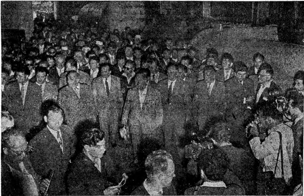
Vizita delegației de partid și guvernamentale a Uniunii Sovietice în frunte cu tovarășul Nikita Sergheevici Hrușciov la uzinele „Grivița Roșie” din Capitală.