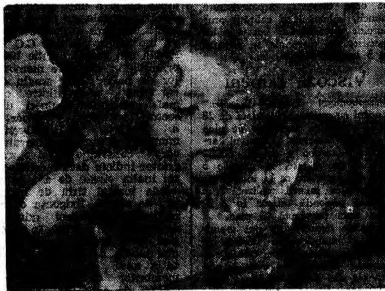
Copiii le plac dulciurile. Acum însă, când luna lui cup-tor își arată din plin puterea, înghețata e cu siguranță cel mai preferat produs de cofetărie.

Noul polimer își va cunoaște aplicarea acolo unde folosirea metalelor este aproape imposibilă. Piese din acest polimer, de exemplu ale unui convector, vor fi de două ori mai rezistente și de trei ori mai rezistente.