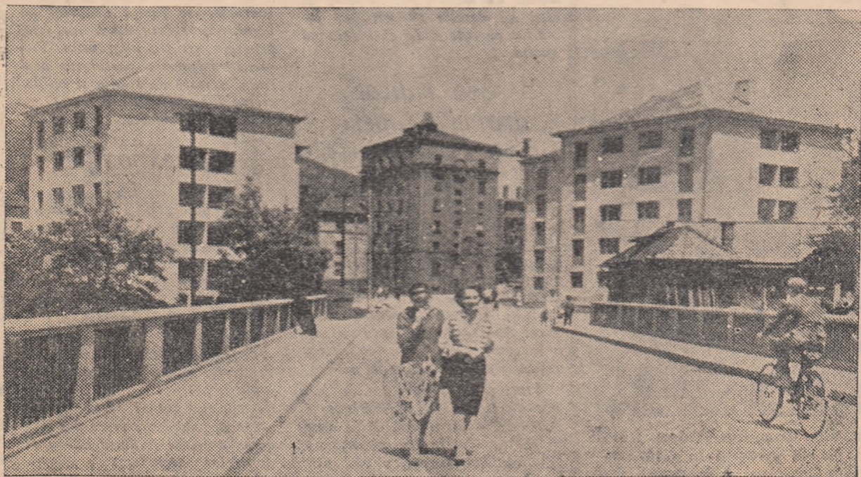
Cartierul Viscoza din Lupeni se îmbogățește an de an cu noi construcții, devenind tot mai frumos.