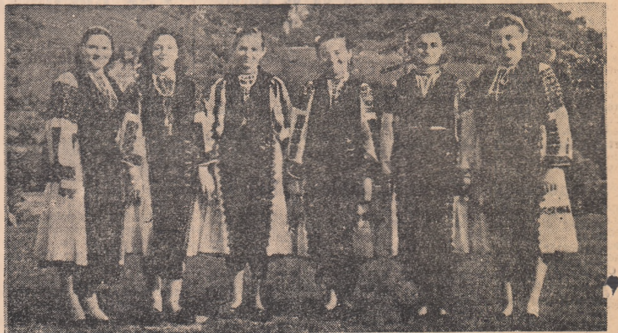
La Iscroni, ca și în celelalte localități din Valea Jiului, nedeile sînt mult apreciate de țărani. Imbrăcămintea fără cusur și bucuria de pe chipul fetelor din clișeu vorbesc parcă de la sine despre acest lucru.