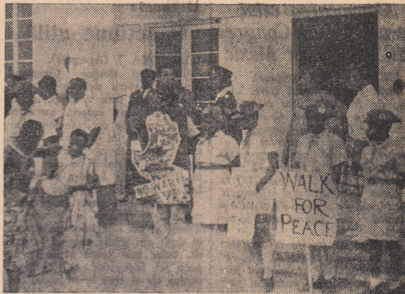
Pionierii ghanezi salută sosirea delegațiilor la Conferința „O lume fără bombe“. Pe partenerii lor scrie: „Nu războiului“, „Opriți experiențele atomice“, „O să acționăm în favoarea păcii“.