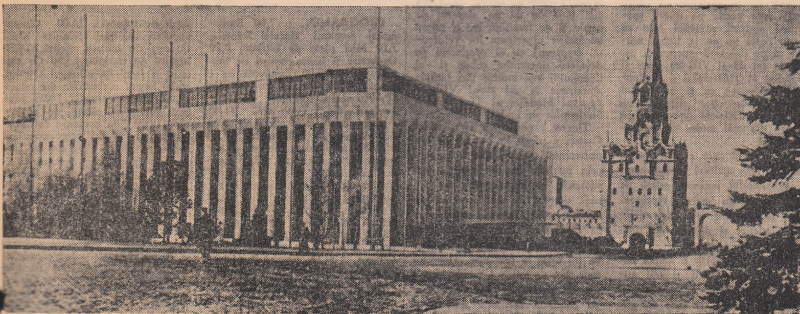
Noua clădire din incinta Kremlinului unde va avea loc deschiderea Congresului mondial pentru dezarmare generală și pace.

• CYRUS EATON, cunoscut industriaș american: Una din premisele cele mai importante ale păcii este comerțul. Sînt profund convins că Statele Unite vor recunoaște într-un viitor apropiat avantajele extinderii comerțului cu țările socialiste din Europa și Asia. Nu este suficient numai să dorești pacea și să vorbești despre ea. A venit timpul ca popoarele lumii să fie pregătite pentru mari transformări care trebuie să intervină în conștiința unor oameni și a unor națiuni întregi.