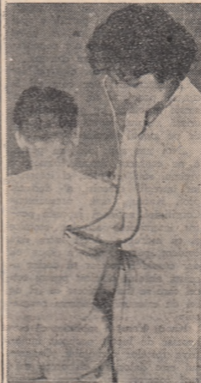
Zhnc, numeroși oameni ai muncii din Aninoasa vin la policlinică pentru consultații, analize etc. fiind îngrijiți cu atenție de medicii.