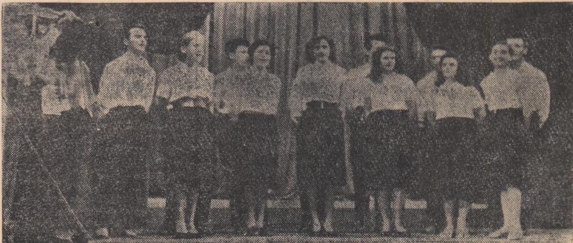
IN CLIȘEU: Brigada artistică de agitație de la I.C.M.M. Petroșani in timpul prezentării unui spectacol.