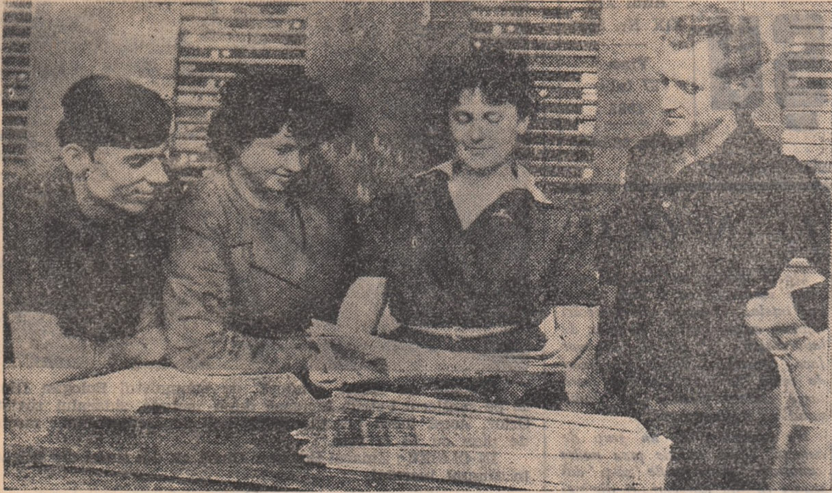
Hărnicia și experiența textiliștilor de la Viscoza Lupeni este deseori popularizată în ziar. După chipurile voloase ale abonaților care se văd în clișeu se pare că articolul apărut în ziarul regional „Drumul socialismului” laudă și de data aceasta activitatea textiliștilor.