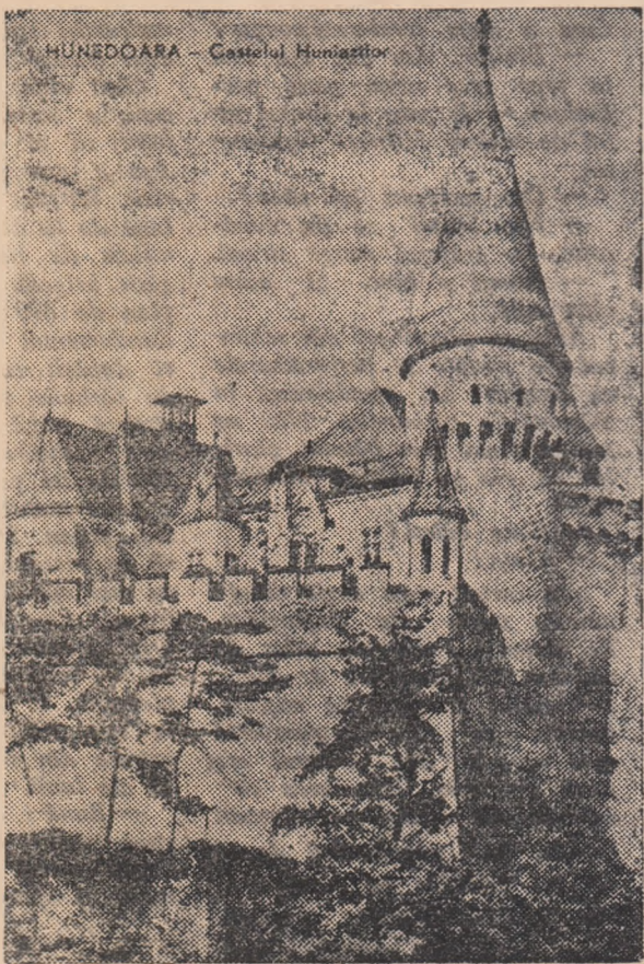
HUNEDOARA — Castelul Huniazilor

In Hunedoara, una din cetățile de oțel ale patriei, noul cu vechiul se îmbină în mod armonios. Castelul Huniazilor, ce se vede în clișeu, e unul din vestigiile trecutului. E impunător nu? Și totuși pe lângă combinatul siderurgic el pare un pigmeu.