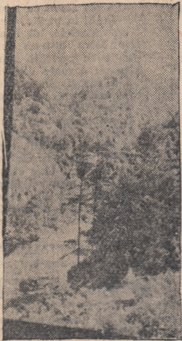
Vedere de pe Valea Jiului.