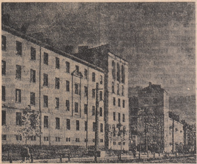
Construcțiile noi, înalte, cu fațade largi ce împinzese toate localitățile Văii Jiului, constituie una dintre cele mai grăitoare dovezi ale schimbărilor adînci petrecute în fosta vale a plîngerii, în viața harnicilor minerii al bazinului nostru carbonifer, prețuți și înconjurați azi cu grijă de statul nostru democrat-popular. IN CLIȘEU: Două dintre noile blocuri din Petrila.

Insufleții de aceste mărețe perspective, de prețuirea ce li se acordă, muncitorii minerii sînt ferm hotărîți să răspundă cu cinste sarcinilor puse de partid și guvern în fața industriei carbonifere, să obțină noi și importante succese, contribuind astfel la desăvîrșirea construcției socialiste în patria noastră scumpă, la făurirea unei vieți mereu mai bune, mai fericite.