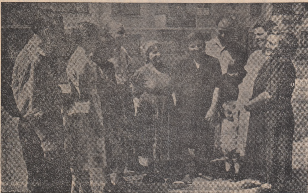
Noul cartier Viscoza III din Lupeni a devenit în acest an un adevărat parc. Pentru mobilizarea cetățenilor la înfrumusețarea cartierului o activitate susținută au desfășurat comitetul de cetățeni din cartier și comitetele de blocuri. Iată-l, în cliseul nostru, pe membrii comitetului din blocul nr. 25 stînd de vorbă cu un grup de cetățeni despre noul actiuni gospodărești în cinstea zilei de 23 August.