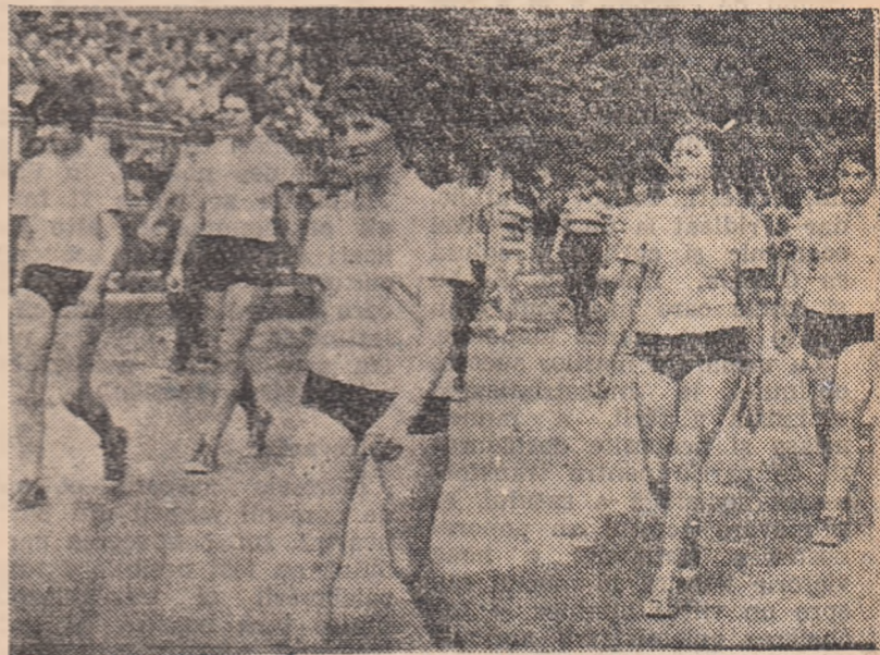
Corpuri oțelite, caractere dirze — iată atributele celor ce se întrec în sport. IN CLISEU: Handbalistele de la colectivul Minerul Vulcan.