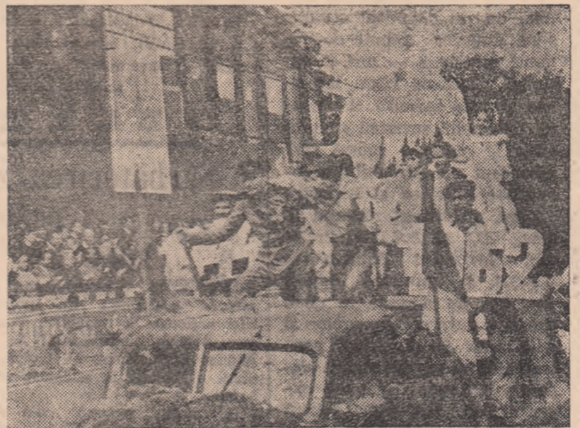
Trece carul alegoric al Teatrului de stat Valea Jiului, simbolizînd frăția de arme sovieto-romină.