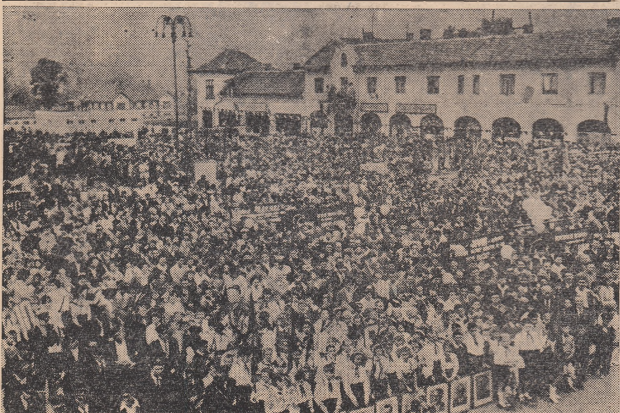
Un decor minunat: O mare de oameni, de drapel și flori — lată aspectul Pieții Victoriei din Petroșani în timpul mitingului închinat mării sărbători.

Demonstrînd prin fața tribunei, minerii din Lupeni și-au exprimat dragostea față de partid, hotărâ-