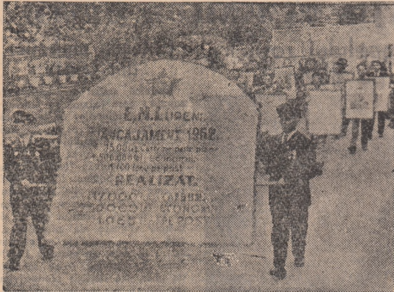
Demonstrează minerii din Lupeni.