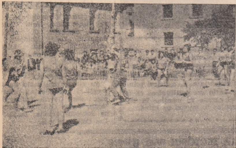
Fază din întrecerea fetelor.

Așa cum a început întîlnirea Petroșani și echipa din Tg. Mureș se părea că victoria va surde