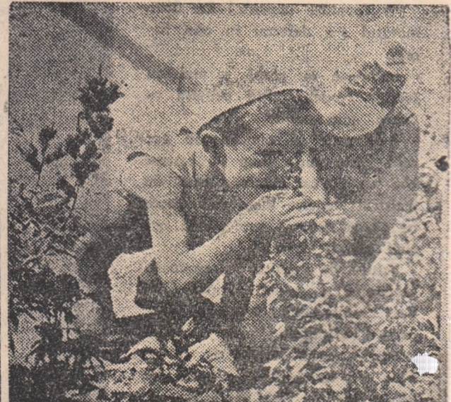
...Iar alții doi cercetează cu atenție o floare din parcul orașului.