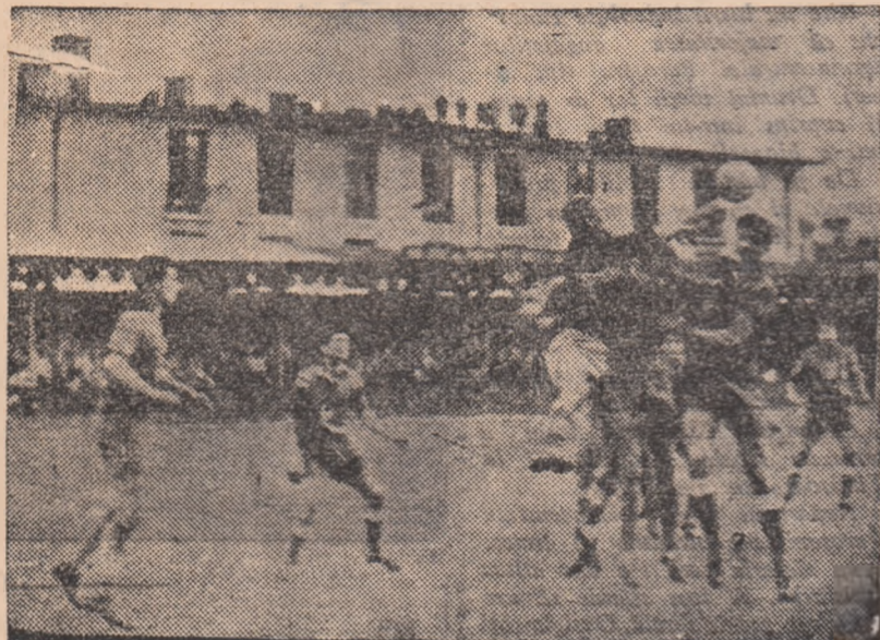
IN CLIȘEU: Fază din meci.

Prima acțiune pe poartă a cugirenilor are loc abia în minutul 15, dar Gram lămurește situația blocînd mingea în picioarele unui atacant. Apoi Jiul atacă din nou obținînd trei cornere în minutele 16, 17 și 25 rămase însă fără re-